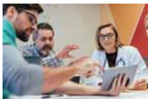
開発・事業化 支援制度、機関