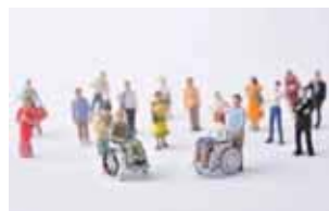
超高齢社会における ヘルスケアシステム・ビジネス