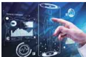
デジタルヘルス (IoT、ウェアラブル、AR/VR、ロボティクス、AI)