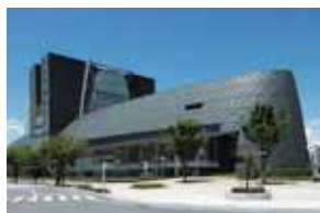
日米の医療機器ビジネスの 専門家が静岡に集結