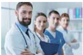
イノベーション創出アプローチ “バイオデザイン”